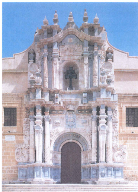
Portada barroca del Santuario de la Vera Cruz , 1722.